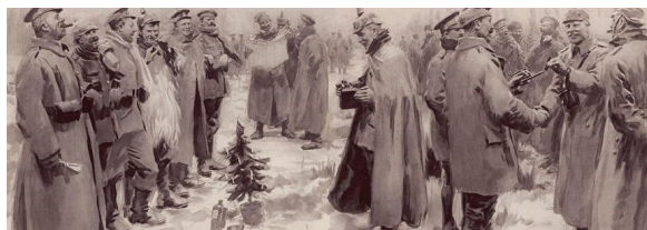
Kerstbestand WO-1, december 1914

2E BRIGADE BREDE REUNIE OP 19 MEI 2022, EEN UITDAGING MAAR WE GAAN ERVOOR!