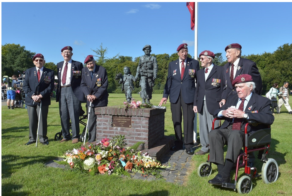
Bloemlegging bij het gedenkteken: Soldaat met bloemenmeisje, in Oosterbeek, op 02 september 2017

Voor meer informatie: www.airbornewandeltocht.nl